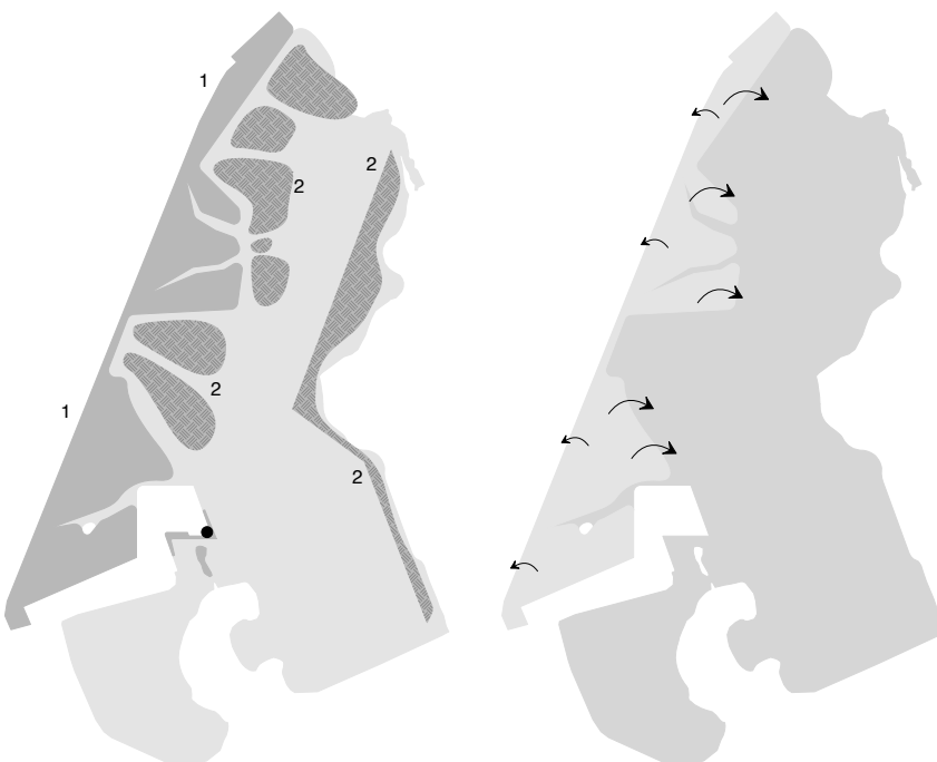
Het rietlandschap bestaat uit 1) het landriet: grilling van vorm en doorsneden met geulen, en 2) het drijvend riet: eilanden van wilgentenen.