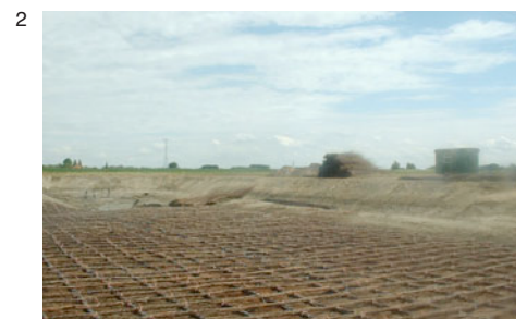
1 Drijvend rieteland (RWS Waterproeftuin 2009) 2 Rijswerk van wilgentenen, basis rieteland